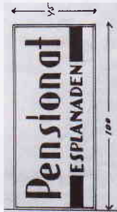
Ritningen av skylten.

1945 ansökte hon om uppsättande av ljusskylt med texten Pensionat, röd och blå text på ljusgul botten. Ansökan beviljades. Hon fick 1947 vitesföreläggande om borttagning av skylt, men fick samma år nytt lov till att uppsätta skylt med text Horell, en utstående skylt med gröna plåtbockstaver på benvit botten. 1948 beviljades utförande av ändringsarbeten, bland annat av fönstret och fasad.