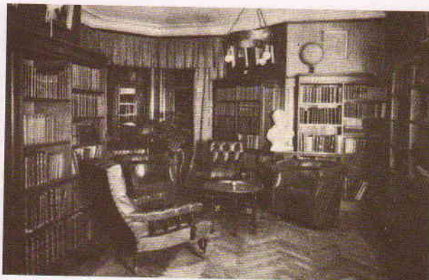
Biblioteket låg i husets torn.

Flera andra böcker skrev O.T. under åren 1904 till 1923, bl.a. "Hvad homöopati utträttat i Sverige", "Vaccinationen : en villfarelse", "Vad är homeopati?", "Den elektriska vibrationsmetoden" och "Sanningen". Han bör ha varit en mycket lärd man med tanke på antalet böcker i biblioteket. Han tjä-