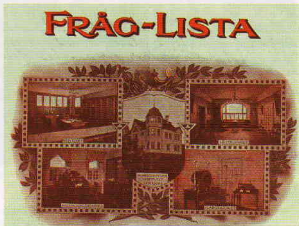
Patienter fick besvara frågor ur Axells Fråg-lista.

När O.T. var 29 år reste han över till Amerika 1897 för homeopatiutbildning. Han for från Liverpool i England med skeppet Teutonic och ankom till New York den 6 oktober. Han betalade biljetten själv. I skeppslistan står han noterad som student och han hade med sig 40 engelska pund. Färden gick sedan vidare till Chicago. Utbildningen till homeopat tog två-tre år och han blev utexaminerad homeopatisk läkare från Hering Medical College i Chicago, Illinois, USA. När han var färdig med utbildningen kom han till Östersund år 1900 och han lät bygga ett stort hus på Strandgatan 14, där han öppnade Homöopatiska institutet.