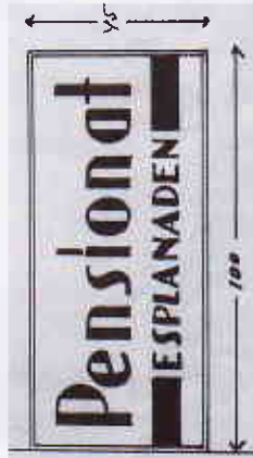
Ritningen av skylten.

1945 ansökte hon om uppsättande av ljusskylt med texten Pensionat, röd och blå text på ljusgul botten. Ansökan beviljades. Hon fick 1947 vitesföreläggande om borttagning av skylt, men fick samma år nytt lov till att uppsätta skylt med text Horell, en utstående skylt med gröna plåtbockstaver på benvit botten. 1948 beviljades utförande av ändringsarbeten, bland annat av fönstret och fasad.