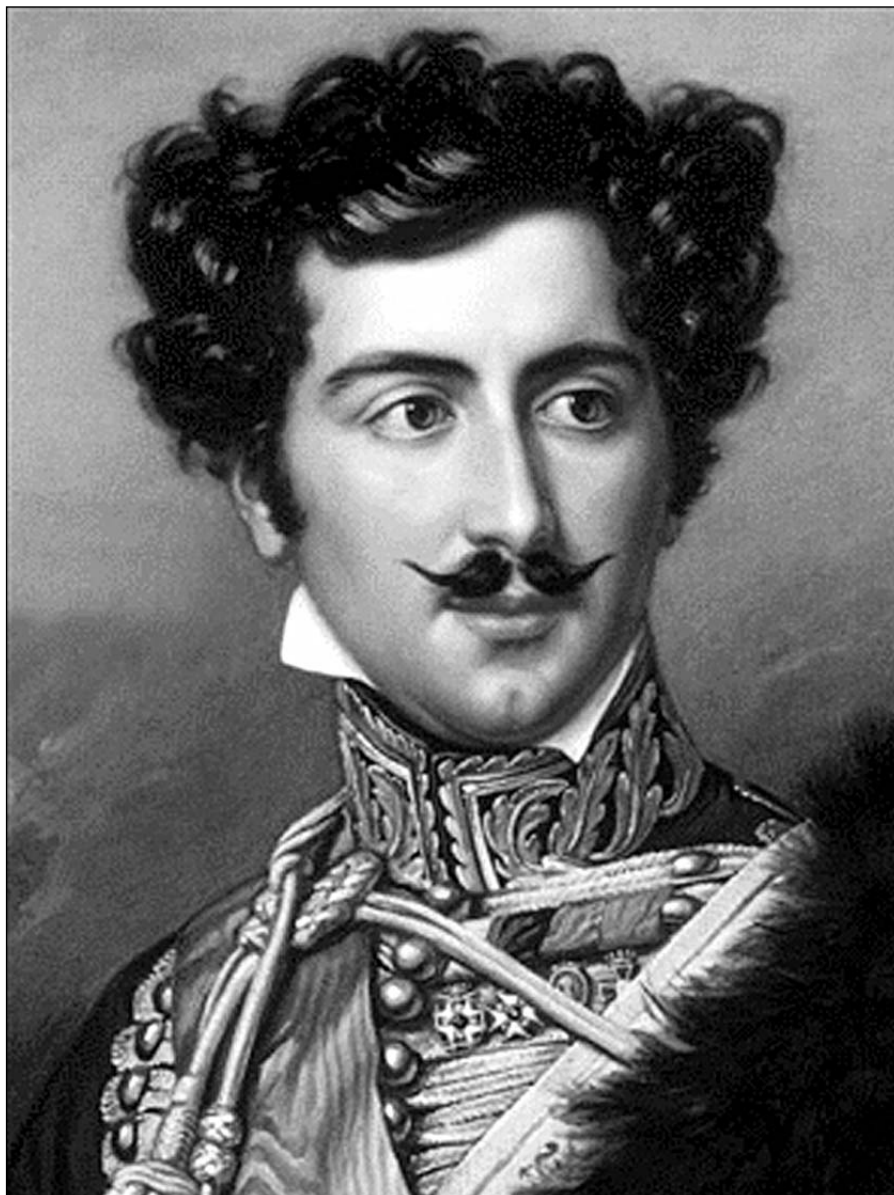
Den blivande Oscar I (1799-1859) var hertig av Östergötland och blev som 12-åring dopvittne i Vreta kloster. Oljemålning av Joseph Stieler 1823.

H.K.H. Kronprinsen som under en resa i landet hedrade Erkebiskopen och dess Fru med ett nådigt besök, på deras egendom Brunnby, under rättad att barnets fader var en av dem, som under Kriget med Frankrike blef tagen tillfånga i Lübeck, der H.K.H. sjelf commenderades, och att samma Lifgrenadier varit fången i Frankrike, behagade i nåder befälla att Döpelse-acten, skulle på stället förättas, och ville sjelf blifva vittne till barnets dop, hvarjemte Han kallade H.K.H. Hertigen och Erkebiskopinnan tillika till faddrar, hvarefter acten för rättades af Erkebiskopen i närvaro af Deras K. Högheters suite, som flere Herrar, hvilka till underdåning uppvaktning sig infunnit. H.K.H. Kronprinsen höll sjelf barnet till Dop, samt täcktes nådigt tillåta att gossen blef kallad efter bägge D.K.H. Carl Oscar....